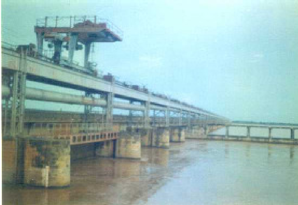
इन्द्रपुरी बराज का दृश्य

सूचना का अधिकार अधिनियम, 2005 सिंचाई भवन, पटना - 800015 वेबसाइट - http://www.wrd.bih.nic.in/